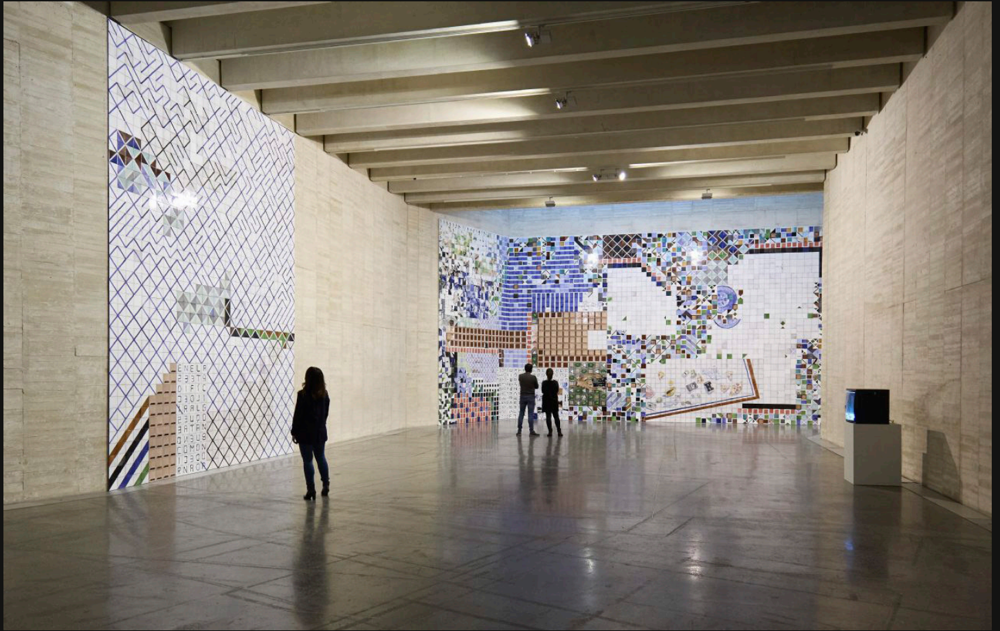
Medir Tierra, 2020 Exhibition at the MUSAC (Museo de Arte Contemporáneo de Castilla y León)