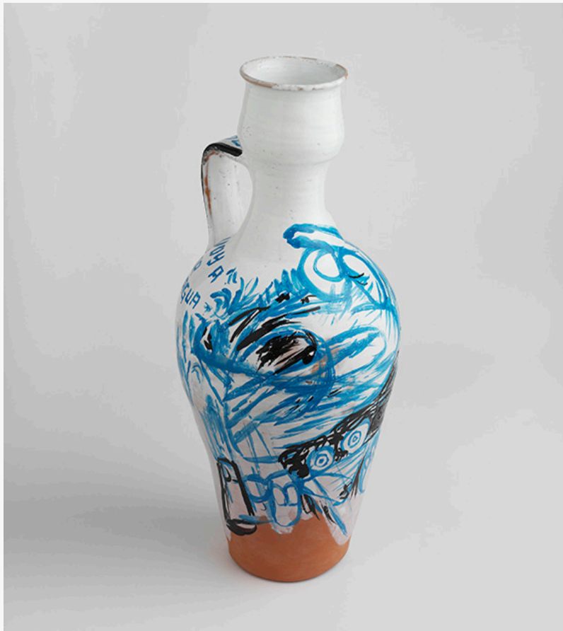
Cántaro II, 2015